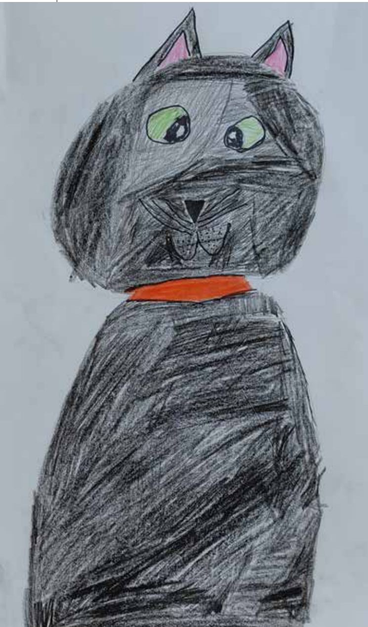
Viktor Vlizlo Perunčić , cl. IV