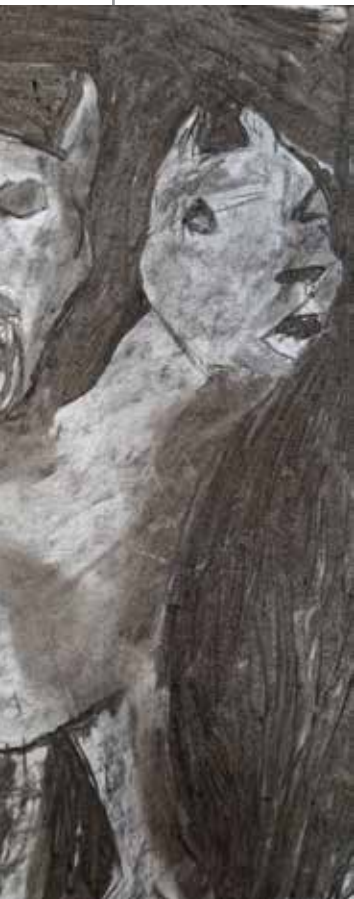
Mate Sambriš, cl. VII