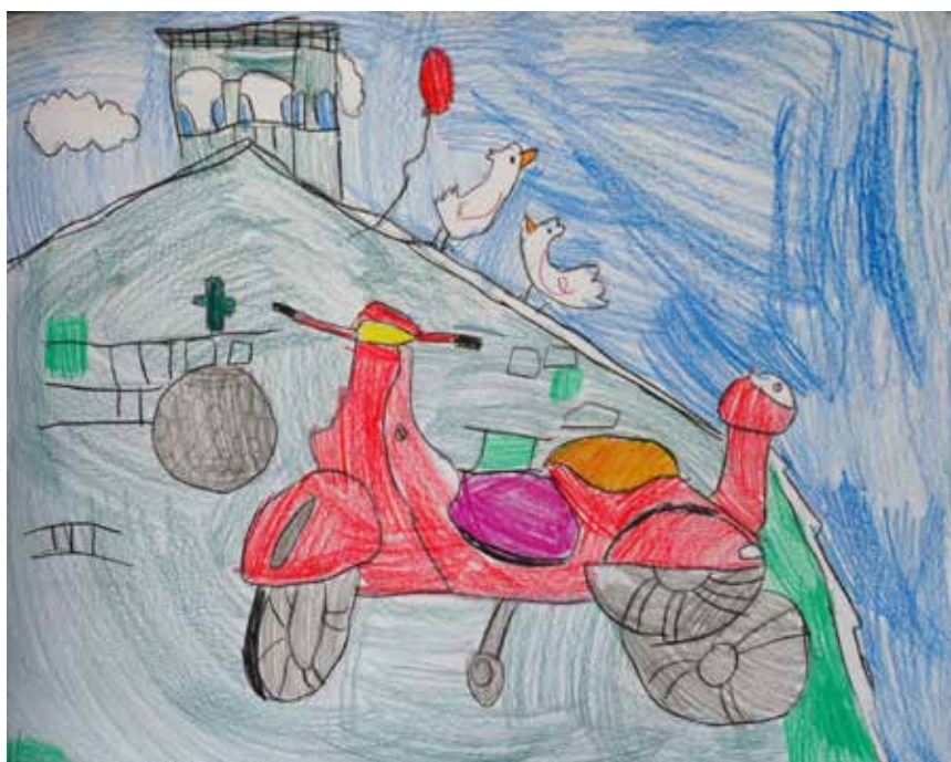
Rocco Štenta, cl. III